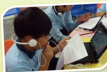
■ 無線網絡配套，讓學生學得更好、更有效。