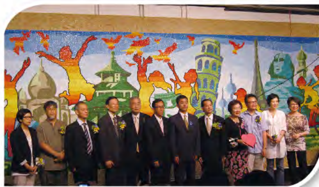
■ 藝術學習、人人平等計劃開幕禮。

樂善堂作為辦學團體，了解到每名小朋友的起步點不同，成長和發展各有異，為此，本堂為轄屬中學生舉辦免費視覺藝術工作坊，同時為教職員提供免費培訓，透過計劃啟發基層學生在視覺藝術上之發展。