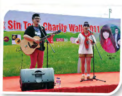
■ 慈善步行大使糖兄妹到場為參加者打氣。