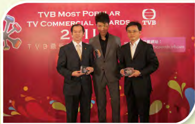
■ 樂善關懷基金電視廣告宣傳片獲TVB最受歡迎廣告優異獎。