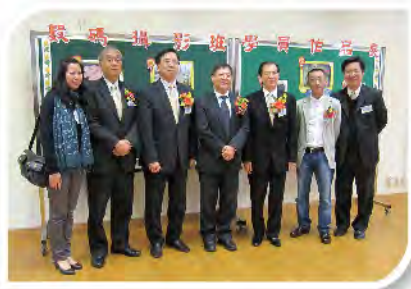
■ 主席與嘉賓們於數碼攝影班學員作品展前合照。