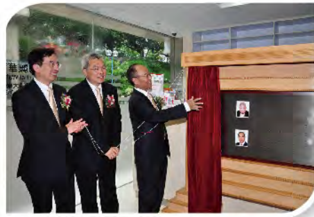
■ 紀念牌匾揭幕儀式。