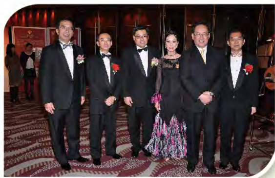
■ 食物及衛生局局長周一嶽醫生GBS太平紳士親臨主禮。

踏入131周年，樂善堂周年慈善晚宴以「樂善關懷百載情 慈善歌舞夜」為主題，邀請到食物及衛生局局長周一嶽醫生GBS太平紳士擔任主禮嘉賓，近800名政府首長、官員、社會名人及各界好友等蒞臨參與，節目包括：由樂善堂小學及樂善堂王仲銘中學學生聯合演出話劇介紹本堂歷史和發展、世界級舞蹈家演出精湛舞蹈等等，晚宴同時為本堂籌得逾百萬元善款，用作慈善用途。