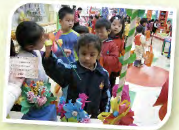
■ 我要挑一朵最漂亮的花。