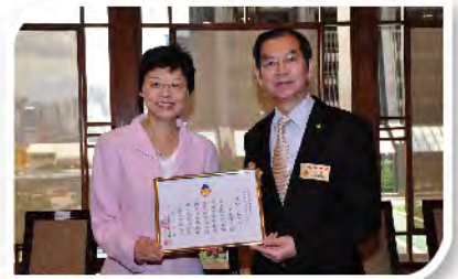
■ 江炎輝主席在午餐會上致送親自題撰之詩篇予民政事務總署陳甘美華署長留念。