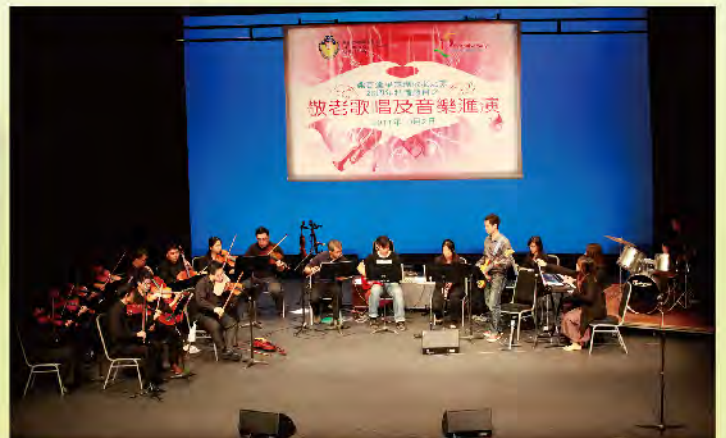
■ 敬老歌唱及音樂匯演。