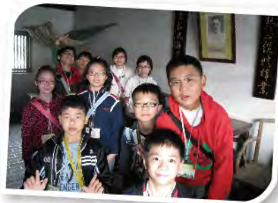
■ 這是葉劍英先生的房間。