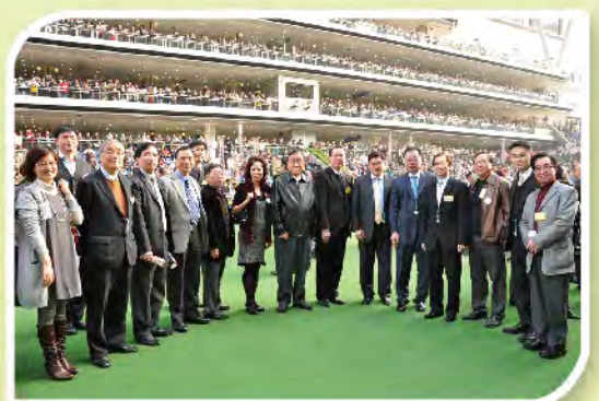
■ 眾參與樂善堂盃之嘉賓一同合照。

樂善堂每年贊助樂善堂盃賽事，並藉此機會，讓常務總理和同寅聚首一堂，一眾嘉賓如懲教署署長單日堅先生伉儷等到場支持。