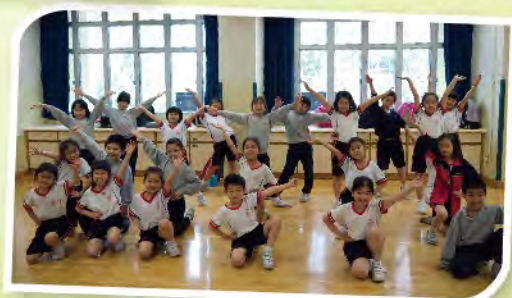
■ 來！一起跳爵士舞。看我們的舞姿多優美！

除此之外，本校於周五為小一及小二學生提供「免費課程」，包括跆拳道、花式跳繩、小型網球、爵士舞、珠心算等，學生毋須付出任何費用，也能得到專業教練的指導。