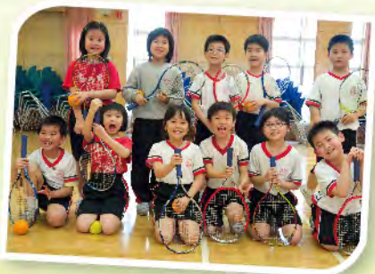
■ 參加小型網球訓練真開心啊！

由於部份的家長需外出工作，未能照顧已下課的子女及指導其完成功課，因此本校今年特別開辦課後託管服務至晚上七時，並由專責老師為60名小一至小六學生提供功課指導及多元化活動，例如：藝術創作、故事演講及電腦學習等。好讓學生能善用課餘時間，亦能減輕在職家長照顧子女的壓力，讓他們安心工作。