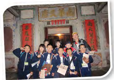
■ 學生在南華又廬門前開心地留影！