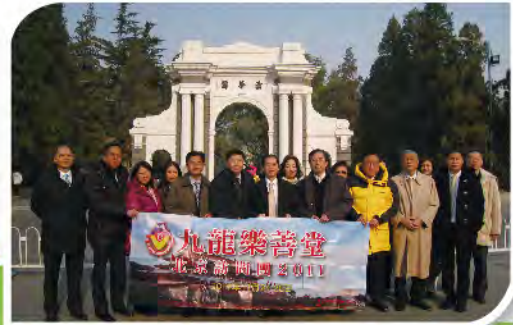
■ 總理們到訪清華大學，作教育交流。