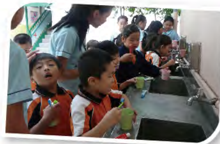
■ 健康學校生活：每天午膳後齊護齒。