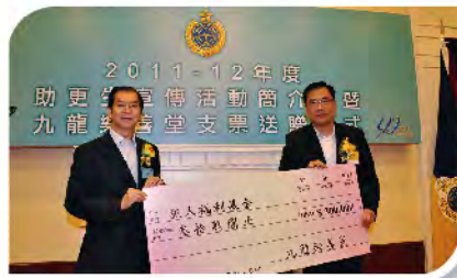
■ 樂善堂一直支持懲教署犯人福利基金，常務總理會慨捐30萬元以示支持。