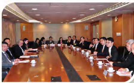
■ 本堂常務總理到教育局拜會和交流。