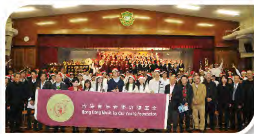
■ 「青年音樂訓練基金」網絡的樂團與本校樂團、合唱團及嘉賓大合照。

在「一人一樂器」計劃的發展基礎上，本校管弦樂團由今年開始，連續三年獲「青年音樂訓練基金」提供樂團的專業培訓及演出機會。去年十二月，本校樂團及合唱團在基金的安排下，與賽馬會毅智書院樂團共二百多人，聯合演出了兩場聖誕音樂會。同學在基金主席、前規劃環境地政局局長蕭炯柱先生、香港大學音樂系副教授兼作曲家陳錦標先生、指揮家何致中先生及吳福臨先生等的指揮下，演奏了多首中西名曲。同學在演奏時表現一絲不苟的態度、自信和團隊協作精神，贏得了全場掌聲！