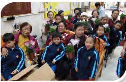
■ 本校師生探訪美林邨東華三院方潤華鄰舍中心。

「老吾老以及人之老、幼吾幼以及人之幼」，為讓兒童學習表示對長者的關愛，提升自我表達能力及增加自信。