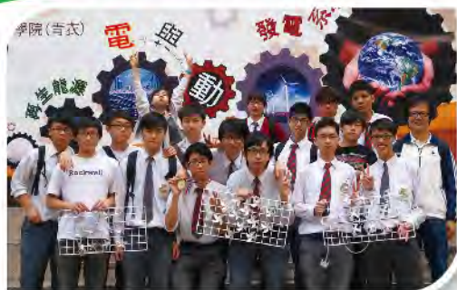
■ 學生在「再生能源電與動系統設計比賽」榮獲亞軍。

「視人子猶如我子，盡心盡意盡力；感師恩等若親恩，春日春雨春風」。本校提倡全人教育，重視五育均衡；期望學生尊師重道，奮發自勵，建立自信，服務社群。近年，本校更著重提升教學質素、優化教學資源及加強與各持分者的溝通與合作。