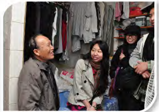
■ 長者們與義工們談起往日趣事，喜上眉梢。