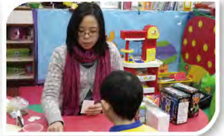
■ 陳姑娘到校都會為有需要的學生進行個別輔導。