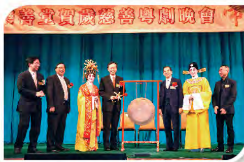
■ 社會福利署署長聶德權太平紳士為賀歲粵劇敲起銅鑼，揭開序幕。