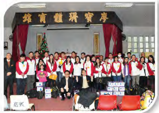
■ 義工們齊集取物資探訪低收入家庭。

樂善之友義工團由最初數人發展至現時2,000多人，當中包括不少愛心企業參與及支持，包括迪士尼、天星小輪、IBM Club、Citibank Hong Kong、恆基兆業發展有限公司、C2司儀義工團、佳定集團、富豪酒店集團、富城集團、沙田第一城義工隊、富昌證券有限公司、先達系統有限公司、和記黃埔有限公司、香港青年獅子會(主會)、電訊管理局、D-photo Volunteer、領達財務有限公司、UIU Volunteer Service Team (HK campus)、Bee's International Group Limited、Sidefame Limited、嘉湖愛心義工隊、捷榮咖啡有限公司、美捷水務有限公司、陽光照明有限公司、金馬倫山青年獅子會、金城營造有限公司、香港射頻有限公司、Megalce、西龍傳香飯糰管理有限公司、消防義工隊、Bay Apparel Limited、何韻詩慈善基金義工團、路政署義工隊、昇鋒國際有限公司、大福證券、永樂國際貿易有限公司、公益青年服務團、香港護士協會義工隊、香港百貨、商業僱員總會服務團等等。由於機構眾多，恕未能全錄。