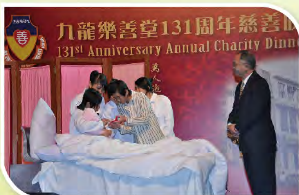
■ 由樂善堂小學及樂善堂王仲銘中學學生聯合演出話劇細訴樂善堂歷史。