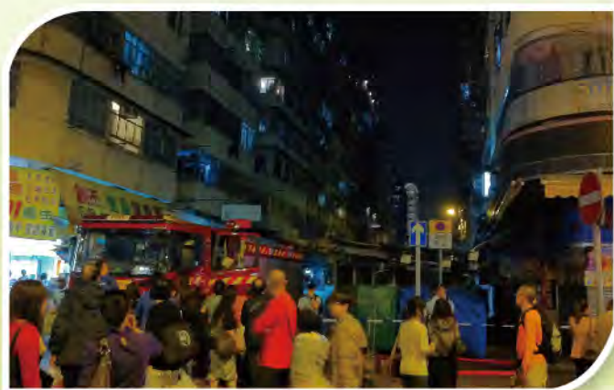
■ 旺角花園街大火後，居民流離失所，緊急的經濟援助猶如及時雨，助他們解決燃眉之急。

樂善關懷基金電視廣告宣傳片更獲得TVB最受歡迎廣告之優異獎，本堂希望藉著宣傳令更多人士支持基金的運作，讓更多有需要人士受惠。