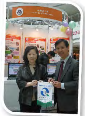
■ 優質教育基金「小學英語漸入佳境學習計劃」獲邀巡迴展覽。