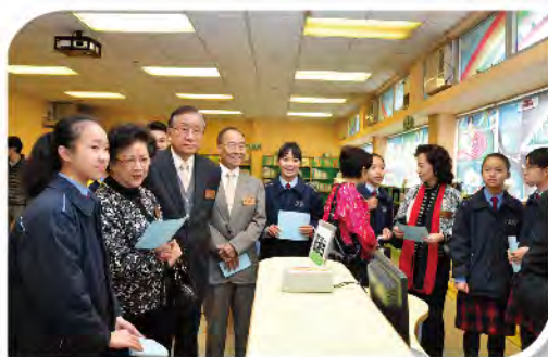
■ 常務總理細心聆聽學生們簡介學校設施。

常務總理會同寅親臨各轄屬教育、安老服務及醫療單位作視察，了解各單位之情況及資源運用等，同時提供寶貴意見和交流，助日後長遠發展。