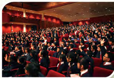
■ 互動環節期間，學生們表現投入。