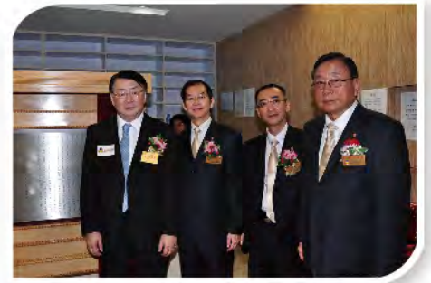
■ 衛生署署長林秉恩太平紳士親臨主持揭幕儀式。