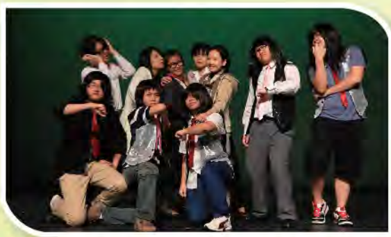
■ 中文校慶劇演員精彩演出。

為慶祝創校二十周年，本校於4月2日及3日舉行校慶開放日暨中西區小學常識問答比賽，除展覽及攤位遊戲外，亦有綜合表演。此外，本校於2011年11月15日舉辦「20周年校慶綜合滙演」，假上環文娛中心演出兩場，日場只供本校學生欣賞，而夜場荷蒙梁潔華博士、本堂主席江炎輝醫生及校監韓世灝博士光臨主禮，並致勉辭；而本堂多位副主席及前任主席與各轄屬學校校長、各界嘉賓、本校家長及校友等光臨指導，益增榮寵。當晚高朋滿座，節目多樣化，包括英文音樂劇，中文校慶劇及巡遊表演等，各同學精彩演出獲一致好評，整個表演在熱烈掌聲中圓滿結束。