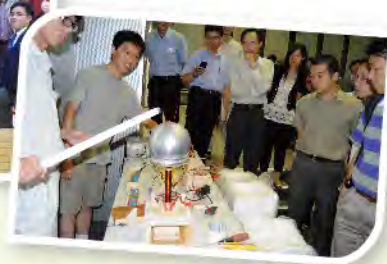
■ 同學於研討會上介紹其專題習作。