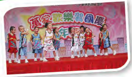
■ 社區表演--萬家歡樂賀國慶。

2011年是本校家長教師會十週年會慶的大日子，12月20日假龍翔中心「好味鍋」酒樓舉行『家長教師會十週年會慶暨聖誕親子茶聚』，筵開25席，約300人參加，家長、師生濟濟一堂，共賀家長教師會十週年會慶。本校同學在席上表演舞蹈、兒歌、唱遊、普通話等遊藝節目助慶，家長委員及義工家長預先準備小禮品用作抽獎遊戲等環節。會上並頒發「家長教師會十週年會慶海報設計比賽」優勝者獎項，場面熱鬧、洋溢一片溫馨歡樂，家校齊心，攜手邁步新一年。