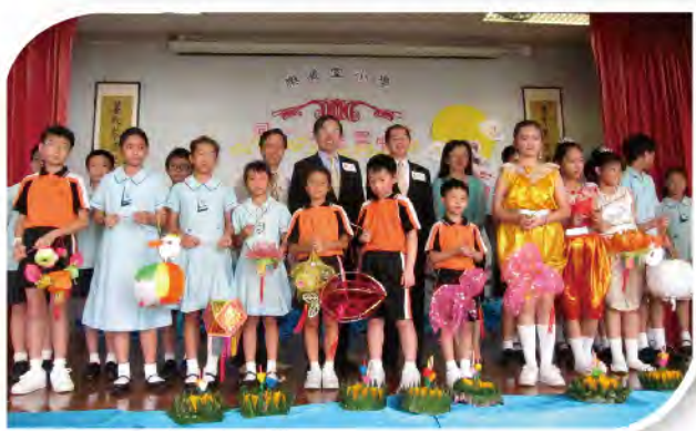
■ 少數族裔與本地學童同渡中秋節。

樂善堂「樂善關懷基金」今年創最高撥款額，本堂撥款達400多萬元，受惠戶數近400戶，當中包括土瓜灣馬頭圍道年初發生的火警、旺角花園街大火以及其他不幸的突發意外和災難。而為宣揚「樂善好施」的精神，「樂善之友」義工隊每逢佳節更出動，為弱勢社群送上佳節禮物和祝福，目前義工人數逾2,000人，當中包括超過50間愛心企業和團體，每年受惠的低收入家庭、獨居和雙老長者近5,000人。