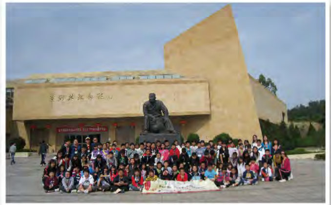
■ 葉劍英紀念館前拍攝的大合照。

這次活動除了令學生深入了解客家文化外，他們亦要學習照顧自己、與人相處、培養自律的精神等，相信對他們日後的成長一定有很大的幫助。