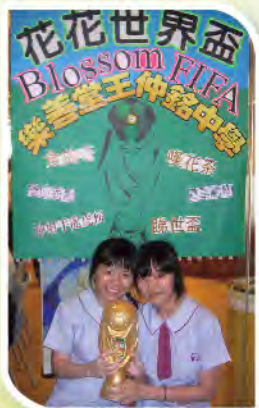
■ 本校參與青年企業家發展局主辦之商校伙伴計劃，榮獲「最佳伙伴學校獎」及「最佳攤位設計獎」。

為配合新學制的理念，擴闊學生的多元學習經歷，本校進行多個跨科學習計劃，其中有本校與香港中文大學建築學院社區營造學社合辦的「啟德河綠廊-社區教育計劃」，本校校長統籌此計劃，區內中小學協作進行環境藝術活動，可說是本區學界和地方發展的創舉盛事。