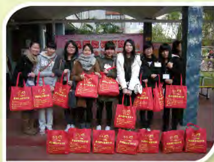
■ 師生參與本堂「歲晚探訪長者計劃」，為區內長者送上關懷溫暖。

而為了推廣樂善精神，本校積極響應各社福機構的邀請，派出師生參與售旗活動，近年學生參與社會服務之人次及時數增長顯著，表現令人鼓舞。