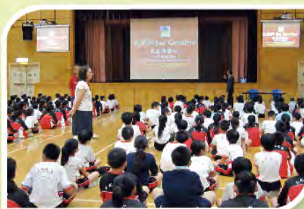
■ 向肥胖Say Goodbye講座。