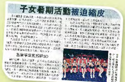
■ 是次活動獲得傳媒廣泛報導。