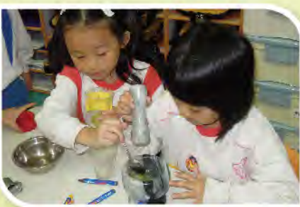
■ 小朋友進行驗證果皮顏色與果汁顏色是否相同的實驗。

樂善堂顧李覺鮮幼稚園於2011-2012年度參與教育局「校本支援計劃之科學探究活動」，高級督學冼美華小姐與科學小組的老師共同備課，組織適合幼兒能力的科學遊戲，幼兒透過日常事物與自然現象的探索，激發幼兒的好奇心，啟發幼兒自發、好奇的探索行為，成為幼兒學習的動力，蘊釀科學的萌芽。老師鼓勵幼兒利用五官進行探索活動，讓他們從實際中操作、學習、探索，又讓幼兒分組進行科學小實驗，培養他們對學習科學的興趣、對事物求真的態度，並掌握觀察、預測、驗證、結果等科學探究的能力。老師適切的提問並引導他們觀察和操作，將科學探究寓於遊戲中，正是幼兒進行科學啟蒙教育的重要途徑。