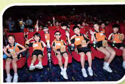
■ 學生們安坐戲院等待欣賞由嘉禾院線贊助之電影。