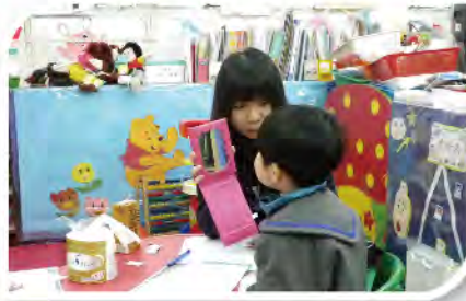
■ 陳姑娘安排語言治療師到校支援有需要的學生。