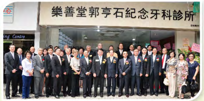
■ 本堂主席、總理與嘉賓們大合照。