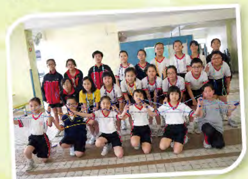
■ 齊來學習花式跳繩！

除此之外，本校於周五為小一及小二學生提供「免費課程」，包括跆拳道、花式跳繩、小型網球、爵士舞、珠心算等，學生毋須付出任何費用，也能得到專業教練的指導。