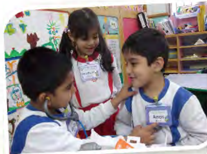
■ 醫生，醫生，唔打針得唔得呀！

為伸延健康教育計劃，除飲食方面，本年度舉辦多項健康活動，例如：家校護齒活動、A+健康及清潔雙手講座、中醫義診、足部檢查和參觀衛生環境資源中心等...，家長兒童參與踴躍。兒童已初步掌握均衡飲食及健康教育等訊息，希望幼兒在日常生活中能持之以恆，注意飲食，多做運動，從而開展更健康、精彩的人生。