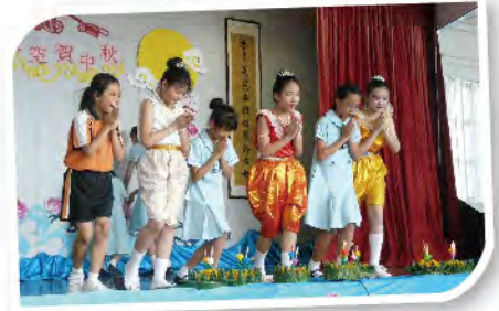
■ 首辦跨文化融合教育活動「中泰同一天空賀中秋」。

樂善堂小學以啓發潛能教育(Invitational Education)及健康促進學校計劃(Health Promotion School Programme)作永續發展的平台。施行小班教育，以「美感教育」貫穿各科，全面引進戲劇教育、合作學習及研習為本學習，並設促進學習的多元評估，加強輔導。特設「成就學堂」計劃，誘發自學和成就動機。同時設立「聰明教室」支援電子學習，建立遠程教室，與中外學校跨地區視像交流。致力營造一所「啓發學生潛能的健康校園」(教育局2009年外評報告評語)。