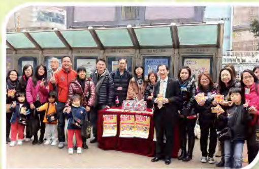
■ 總理們身體力行，出錢出力。