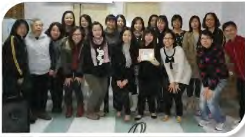
■ 教師語障培訓工作坊。

本港的特殊幼兒教育需要，一向嚴重缺乏，為提供幼兒及家長服務的需求，是年本校參與協基會舉辦之「Head start幼稚園駐校社工服務計劃」，每周均有兩天註冊社工到校，目的是觀察幼兒在校的行為、情緒上的不同需要，從而作出適切的個別、小組輔導或轉介；此外更安排言語治療師為教師作培訓，讓教師對幼兒言語障礙加深認識，往後更會安排家長講座；盼能讓幼兒、家長及教師三方面作出全面的支援，此外亦有樹仁大學輔導學系的第四年學生每周兩天到校實習，開設學習小組活動，以提升本校兒童的專注及社交技巧，以全面協助老師發掘兒童的潛能。