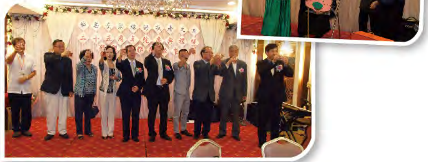
■ 25周年院慶暨懇親聯歡會。

今年正值樂善堂梁銻琚敬老之家成立二十五周年之際，除印刷「樂伴情牽二十五載」紀念特刊外，本院成功舉辦了一系列以「和諧家庭及敬老」為主題的音樂敬老活動。