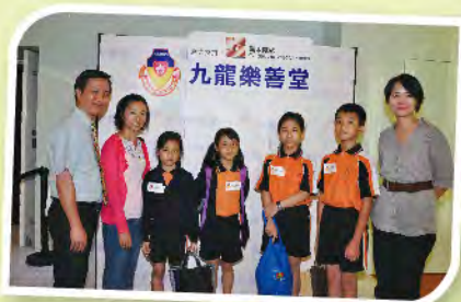
■ 來自基層的參加學童表示他們是第一次入戲院欣賞電影。

樂善堂轄屬學校學生約有8成多來自基層家庭，每逢暑假，他們所能享受之暑期活動不多。本堂今年度首獲「嘉禾院線」贊助轄屬中、小學生700多人於嘉禾黃埔戲院免費欣賞暑期上映之3D卡通動畫電影，更免費提供飲品及爆谷，當中大部份學生更是第一次入戲院欣賞電影，他們均表示珍惜及難忘。