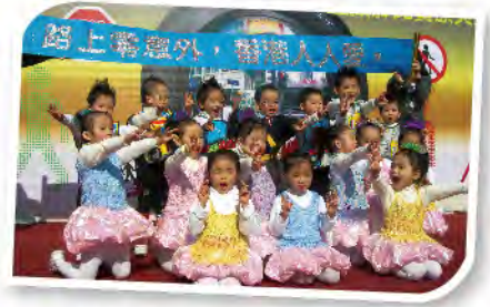
■ 社區表演--秀茂坪交通安全城開放日。