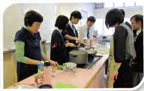
■ 長幼共同製作雲吞雞。

2012年3月3日，學苑舉行《活動回顧暨嘉許禮2011》，邀請安老事務委員會主席陳章明教授BBS太平紳士主禮致訓，同時為成立《樂善堂長者學苑室內硬地滾球隊》進行誓師儀式，隊員們穿上球衣，排列整齊、