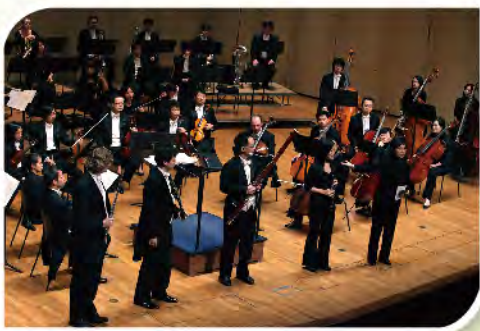
■ 由葉詠詩指揮及帶領樂團，讓基層學生有機會欣賞到交響樂並學習知識。

本堂贊助逾一千二百多名轄屬學校小學生參與由樂善堂及香港小交響樂團合辦、由音樂總監葉詠詩親自指揮和主持之「樂聚一小時：校園篇」活動，讓小學生親身到沙田大會堂欣賞交響樂，透過互動環節及音樂欣賞認識當中的「四大家族」，包括：弦樂、木管樂、銅管樂以及敲擊樂的特性、發聲原理以及聲音等，同時以「四大家族」奏出不同樂曲，快板的羅西尼-《「威廉·泰爾」序曲(選段)》、布拉姆斯-《G小調第五匈牙利舞曲》、比才-《卡門：鬥牛士之歌》、西貝遼士-《芬蘭頌》以及配合佳節的安德森 -《聖誕節日》。