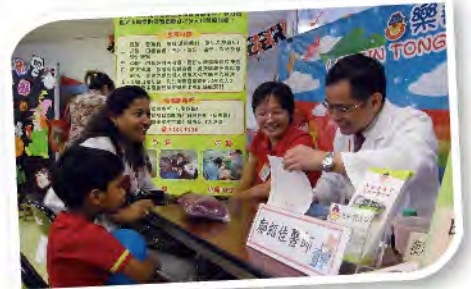
■ 於樂善堂鄧德濂幼稚園義診。

此外，轄屬的專業醫護人員到不同的學校和安老服務機構，為學生和長者們舉辦不同內容的專題健康講座，包括：「認識糖尿病」、「哮喘及氣管敏感」、「向肥胖Say Goodbye」、「男生的秘密」、「失眠的成因和預防食療」、「淺談長者常見病之高血壓」、「中醫養生之秋冬食療保健」及「口腔及牙齒護理」等，加強不同人士對相關疾病的認識、治療和預防，反應熱烈。