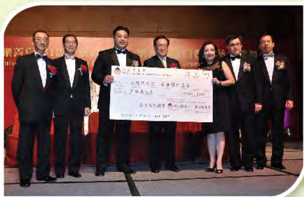
■ 晚會上舉行樂善關懷基金支票頒贈儀式。