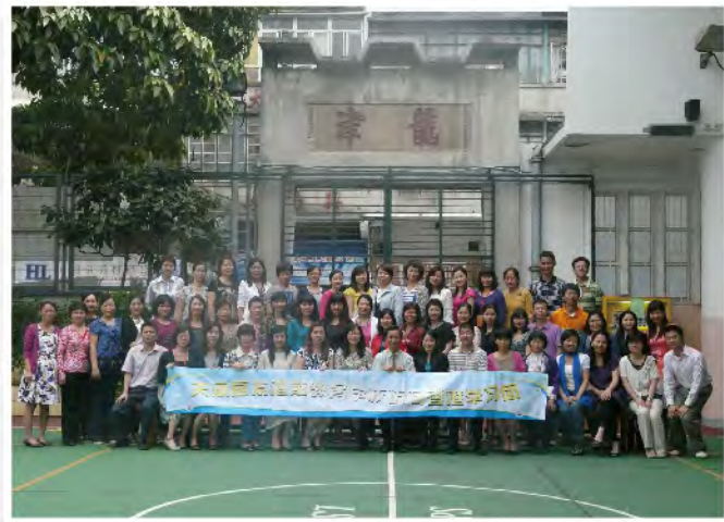
■ 廣州天河區友校來訪交流啓發潛能教育推行經驗。