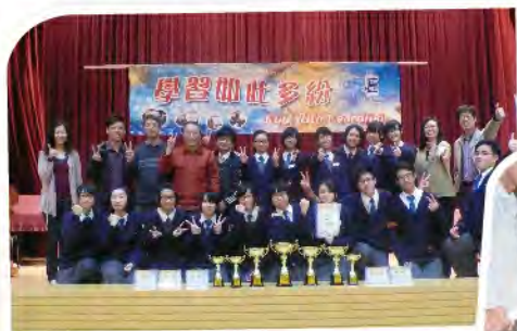
■ 「學習如此多紛2012」全場總冠軍。

此外，初中綜合人文科亦積極鼓勵學生參與有關「專題研習」的公開比賽。本年三月，同學於「學習如此多紛2012」軟件及專題研習設計比賽中取得豐碩成果，包括：學校全場總冠軍、初級組全場總冠軍及亞軍、高級組全場總冠軍、一等獎三項、優秀創意獎一項、優秀資料處理獎兩項、優秀演繹獎一項及優秀研習報獎一項。