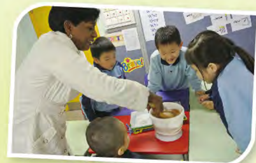
■ 透過造蛋糕學英語，有趣又實用，真樂！

觀課後，家長對本校教師的教學給予高度的評價。其實，提高家長對課堂教學的了解，能優化家校伙伴關係，故除現場觀課外，我們更把上課情況錄影，然後透過內聯網播放，使未能出席的家長，也可於網上收看學生上課情況，加強溝通。