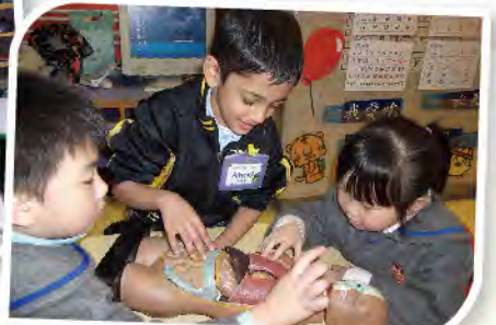
■ 原來人體構造真係好複雜。