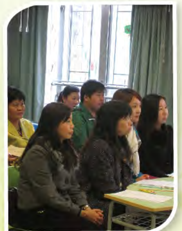
■ 看，家長們觀課多認真。