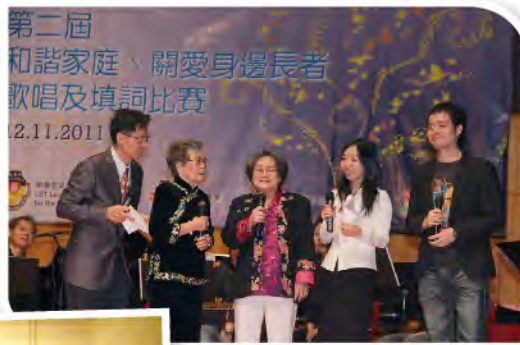
■ 和諧家庭、關愛身邊長者歌唱及填詞比賽。

2011年4月於竹園舉辦敬老音樂會「中西樂韻遍竹園」；10月2日於牛池灣文娛中心舉辦了「敬老歌唱及音樂匯演」，兩項敬老活動共招待了竹園及鄰區500名坊眾及長者。本院亦於2011年10月11日在院內舉辦了慶祝25周年生日會，與長者一起渡過溫馨的25周年生日，內容有切蛋糕、吃燒肉，同時亦向參加敬老學院的院友頒發敬老學院證書和禮物；而於2011年10月21日在竹園廣場百利海鮮酒家舉行了25周年院慶典禮暨懇親會聚餐，筵開二十多席，有本堂主席、總理及陳總幹事等嘉賓蒞臨頒發長者義工、外界義工及員工服務獎，以表彰義工過去的付出和努力。整個聚餐充滿笑聲，長者與親友共渡了一個歡樂的晚上。