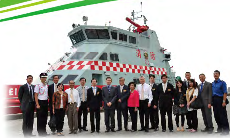
■ 總理們參觀消防船。

樂善堂在教育、社會福利、醫療及其他公益活動上，與各政府部門保持緊密合作，常務總理會每年親自拜訪各部門，一方面了解目前社會需要，另一方面與時並進籌劃新服務和項目。本年度樂善堂拜會團體包括：