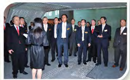
■ 本堂同寅參觀新立法會大樓。